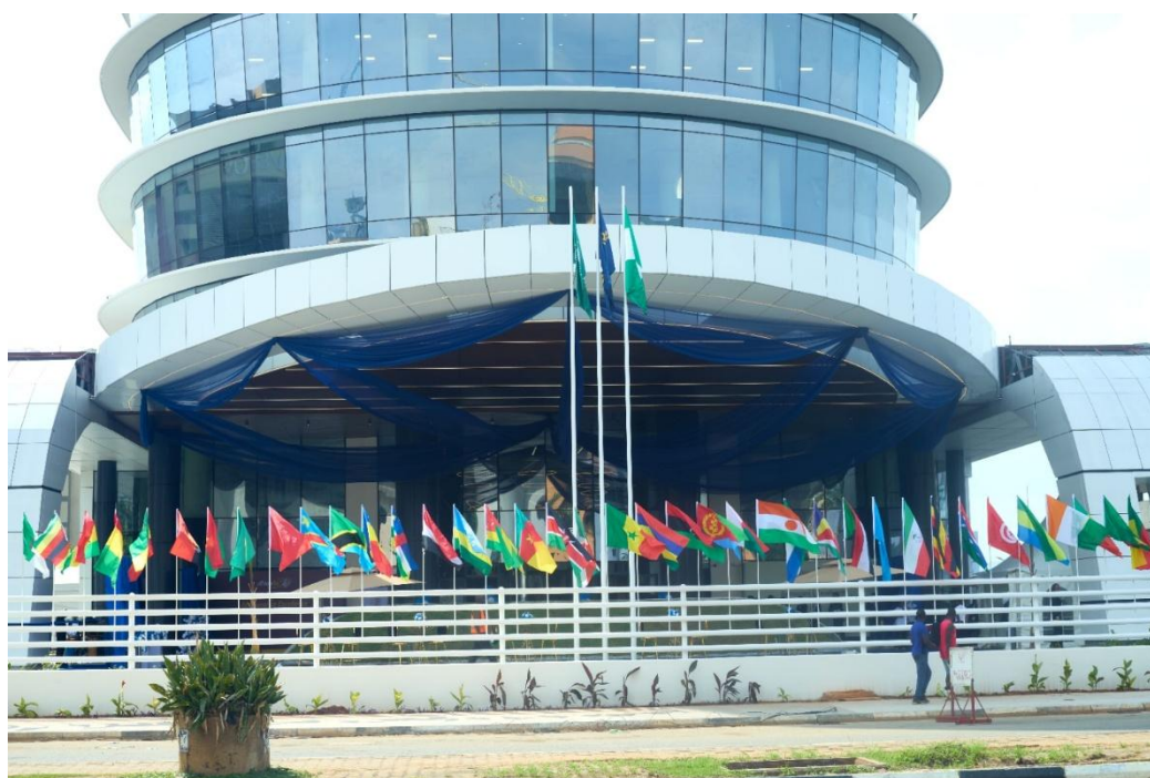
Le nouveau siège d'Africa Re à Abuja

Conçu pour être plus qu'un lieu de travail, le nouveau siège a été perçu comme un espace de vie dynamique, propre à favoriser le bien-être, la collaboration, la productivité et la communauté. Doté de systèmes et d'équipements de pointe, notamment d'un restaurant haut de gamme, d'une salle de sport aux normes internationales, d'un espace dédié aux enfants et de jardins suspendus, le bâtiment illustre la confiance d'Africa Re dans les solutions venant des Africains, ainsi que sa disponibilité à continuer à œuvrer en vue du renforcement des marchés de l'assurance et de la réassurance du continent. Intervenant cinquante ans après la création de la Société à Yaoundé, en 1976, l'inauguration de ce siège social emblématique est le signe de la continuité entre la mission fondatrice d'Africa Re (la rétention des primes de réassurance en Afrique et la réduction de la dépendance structurelle à l'égard des marchés étrangers) et son orientation future en tant qu'une des institutions financières les plus solides du continent.