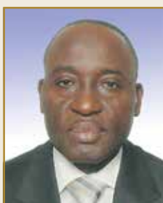
Issofa NCHARE Directeur des Assurances Ministère des Finances, Cameroun

En 2014, la croissance du PIB réel est projetée à 4,8%. Elle s'annonce plus diversifiée et plus régulière dans ses sources.