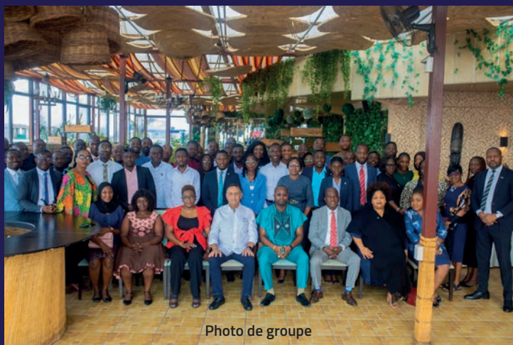
Photo de groupe