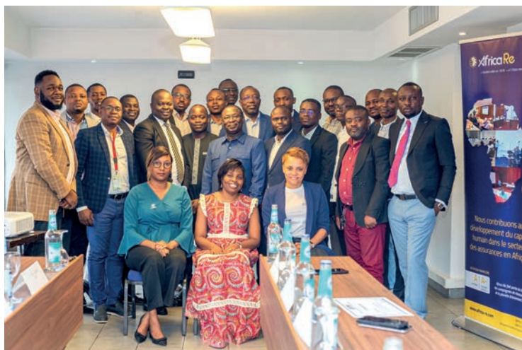
Photo de groupe des participants et animateurs