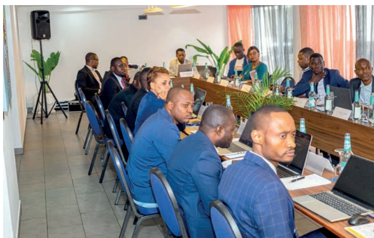
Vue partielle des participants