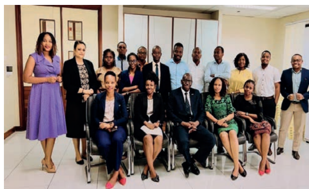
Photo de groupe des participants et animateurs