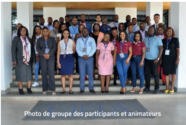
Photo de groupe des participants et animateurs

Pour la première fois dans l'ère post-COVID, le Département Non-Vie d'Africa Re a organisé avec succès une formation accélérée qui a connu la participation des principales compagnies d'assurance générale de Zambie et d'autres parties prenantes telles que l'autorité de contrôle et certains courtiers en réassurance.