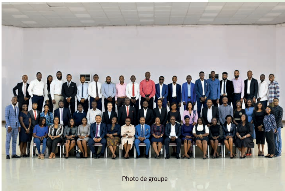
Photo de groupe

Le Bureau Régional d'Afrique de l'Ouest anglophone d'Africa Re a organisé un séminaire sur les techniques de gestion durable des risques pour l'assurance vie.