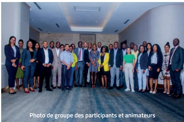
Photo de groupe des participants et animateurs