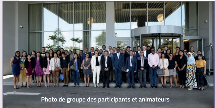
Photo de groupe des participants et animateurs

de base aux différents types de couvertures de réassurance, en passant par les considérations clés pour l'élaboration d'un programme de réassurance. Des échanges d'expériences enrichissants ont eu lieu au cours des sessions, compte tenu de la diversité des