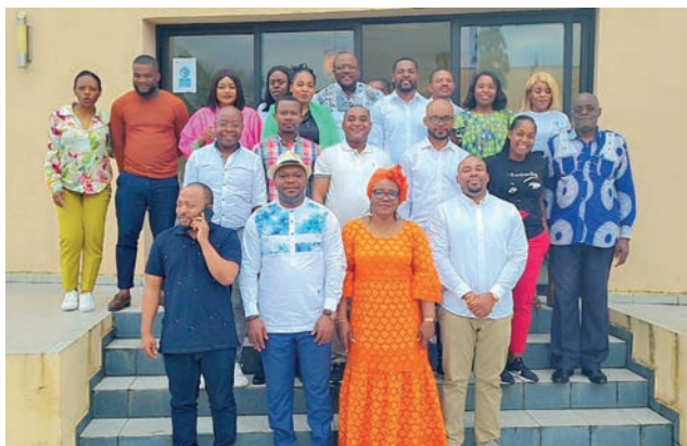
Photo de groupe des participants et animateurs Séminaire GEPS 2022

Africa Re a organisé une formation en souscription d'assurance incendie pour les cadres de GE Petrol Seguros en Guinée Equatoriale. La formation qui a eu lieu au siège de la société à Malabo, à la demande de l'entreprise a pour but de renforcer la compétence technique des cadres en souscription d'assurance incendie. Les 10 participants qui ont assisté à la formation de 4 jours travaillent dans différents départements de la société y compris celui de la souscription, des sinistres et de la réassurance. L'objectif était d'améliorer les compétences techniques des participants dans le domaine de la tarification et aussi d'améliorer la compréhension de la formulation des polices d'assurance.